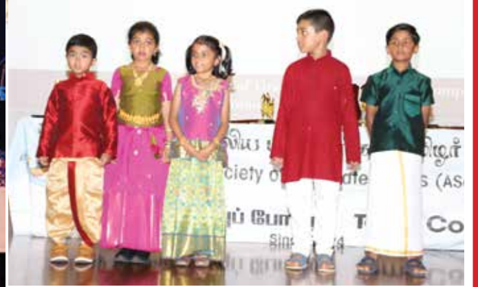
அனைவரும் இத்தருணத்தில் மிக்க நன்றியுடன் நினைவு கூரப்படவேண்டியவர்கள்.

காலத்தின் தேவையாய் - பாடசாலைகள், மாநிலங்கள் கடந்து தமிழ் இளையோர்களை இணைக்கும் பாலமாக - ஆஸ்திரேலிய கண்டமெங்கும் தமிழ் ஊட்டலை ஊக்குவிக்கும் இந்த செயற்திட்டத்துக்கு சமூகமாய் மேலும் வலுச் சேர்த்து, வரும் தலைமுறையெல்லாம் பயனுற வழிசமைப்போம்.