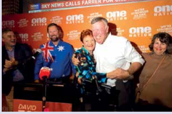
Farrer தொகுதி இடைத்தேர்தலில் லிபரல் கட்சி அடைந்த தோல்வி மற்றும் ஒன் நேஷன் கட்சியின் வெற்றி குறித்து தனது கருத்துக்களை பிரதமர் அந்தோணி அல்பானீஸ் பகிர்த்துள்ளார்.

வரும் காலங்களில் மற்ற தொகுதிகளையும் கைப்பற்றும் நோக்கில் ஒன் நேஷன் கட்சி தனது தேர்தல் விபூகங்களை விரிவுபடுத்தத் திட்டமிட்டுள்ளது.