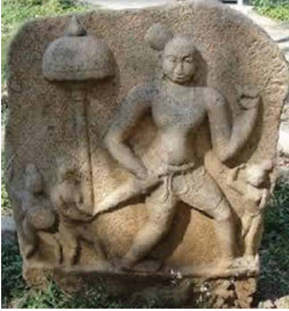
எண்ணமுன் நிலன்மின் தெவ்விர பலரென்னை முன்னின்று கல்நின்றவர்.

இந்தத் திருக்குறளின் பொருளாவது “பகைவர்களே!, எங்களது வீரம் மிகுந்த தலைவன் முன்பு எதிர்த்து நிற்க சிறிதும் துணியாதீர்கள் . ஏனெனில் அவரை (என் தலைவனை) வீழ்த்துவேன் என்று வெற்றுச் சாகசம் செய்த பகைவர்கள் எல்லோரும் அவரிடம் போரிட்டு வீழ்ந்து நடுகற்களாய் அவரவர் வீட்டில் (நாட்டில்) நிற்கின்றனர்” என்பதாகும். இந்த குறளுக்கு எழுத்தாளர் ஜெயமோகன் வேறு ஒரு உரை கூறியதாக நினைவு. இந்தத் திருக்குறளை ஒப்பிட்டு பார்த்தோமானால், தலைவரையும் அவரது வீரர்களையும் நேருக்கு நேர் தைரியமாக போரிட்டதால் நடுகற்களாய் பகைவர்கள் நிற்கின்றனர் என்பது நாம் அனைவரும் அறிந்ததே. போர்க்களத்தில் சண்டையிட்டு மாண்டு போன வீரர்களுக்கு ஈமக்கடன் ஈந்து கல் நட்டு வழிபடுவது நமது பண்டைய தமிழ் மரபு ஆகும். இவ்வாறு நடப்பதே கற்களே நடுகற்கள். தமிழகத்தில் சங்க காலம் தொடர்ந்தே வீரர்களுக்கு நடுகல் வைக்கும் வழக்கம் இருந்துள்ளது.