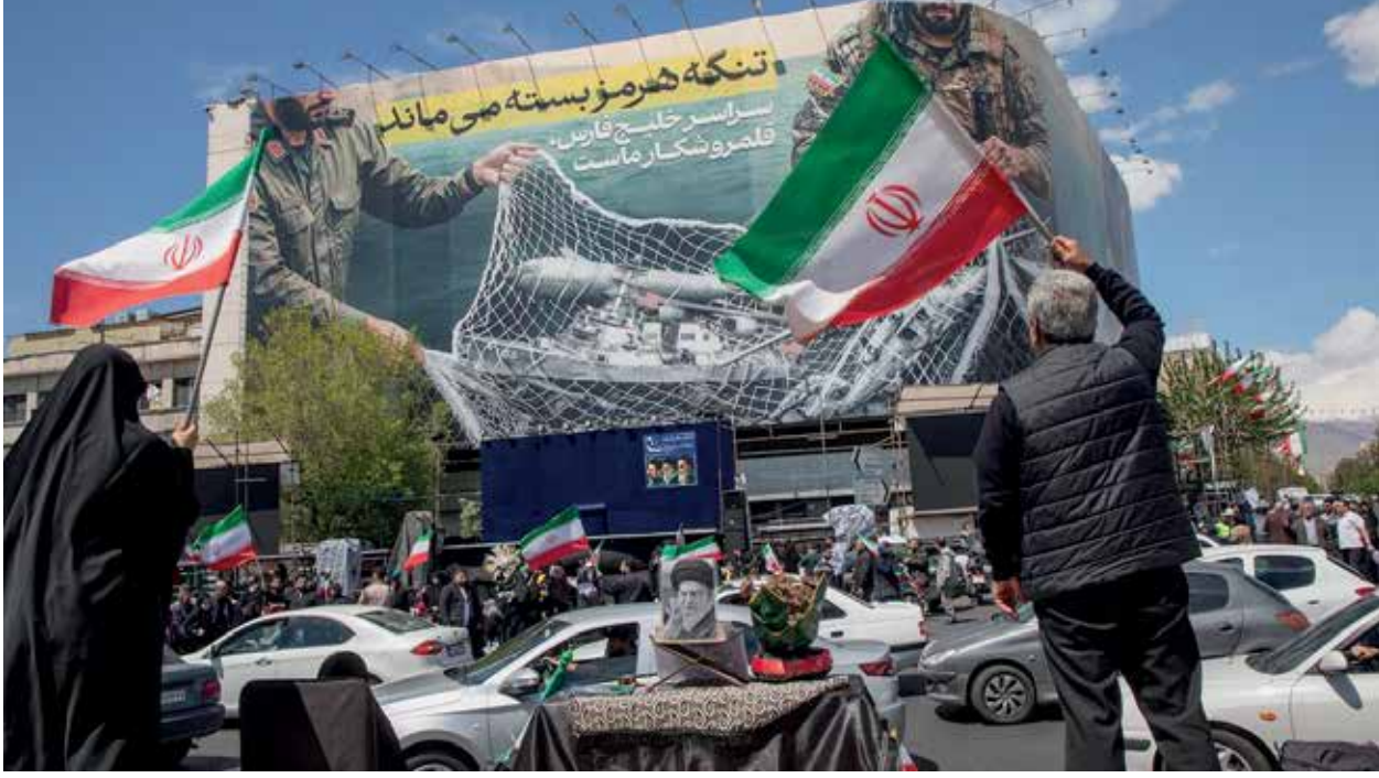
(06ஆம் பக்கத் தொடர்ச்சி)

அமெரிக்காவும் இஸ்ரேலும் ஈராணை ஒரு 'செத்த பாம்பாக' எண்ணித் தொடர்ந்து தாக்கின. ஆனால், இன்று தெஹ்ரான் முன்னெப்போதும் இல்லாத வகையில் வலுப்பெற்றுள்ளது.