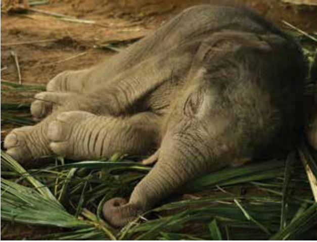
குரலும் கொள்ளாது நிலையிலும் பெயராது படாஅப் பைங்கண் பாடுபெற்ற றெய்யென மறம்புகல் மழுகளிறு உறங்கும்”

உ லக மகளிர் தினம் மார்ச் 8ஆம் திகதி கொண்டாடப்படுகிறது என்பது நாம் எல்லாரும் அறிந்தது தானே. அதையொட்டி இணையத்தில் உள்ள அனைத்து சமூக ஊடகங்களிலும் திடீரென்று மகளிர் மாண்பினைப் போற்றும் சுட்டிகள், பதிவுகள் ,காணொளிகள் எல்லாம் நிரம்பி வழிந்தன. இப்படி பெண்மையைப் போற்றும் ஆண் மகன்களை எண்ணி எனக்கு கண்ணீர் சுரந்தது. இது எல்லாம் ஒரு நாள் கூத்து என்பது நம் அனைவருக்கும் தெரிந்தது தானே. வடிவேலு ஒரு திரைப்படத்தில் காலையில் எழுந்தவுடன் நன்றாக சாமி எல்லாம் கும்பிட்டுவிட்டு தனது தாய் தந்தையரை தெய்வமாக எண்ணி வணங்கிச் செல்வார். அதே நாள் இரவில் நன்றாக சாராயம் குடித்துவிட்டு வந்து ,அதே தாய் தந்தையரை கண் மூடித்தனமாக தகாத வார்த்தைகளில் திட்டி ,அடித்து விடுவார். இது ஒவ்வொரு நாளும் நடக்கும் காரியம். இந்தக் கூத்தினைப் போலத்தான் மகளிர் தினக் கொண்டாட்டப் பதிவுகளும் என்பது தான் நிதர்சன உண்மை. இந்தப் பதிவினை எழுதிக்கொண்டிருக்கும் இதே வேளையில், சிட்னியைச் சேர்ந்த ஒரு புலம்பெயர்ந்த இந்தியப் பிரபலர் ஒருவர், 39 பாலியல் பலாத்கார வழக்குகளில் சிக்கி 40 வருட ஆயுள் தண்டனைக்குள்ளான செய்தியைக் கேட்டு துயருண்டேன்.